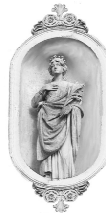
DOMENICA 16 FEBBRAIO Vª DOM. TEMPO ORDINARIO